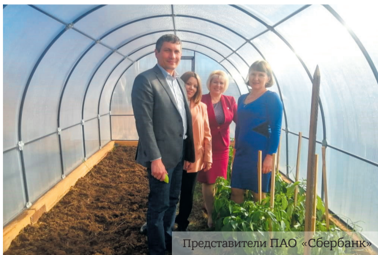
Представители ПАО «Сбербанк»

Сегодня 8 образовательных организаций Братского района участвуют в реализации Концепции развития непрерывного агробизнес-образования на сельских территориях Иркутской области с 2018 года.