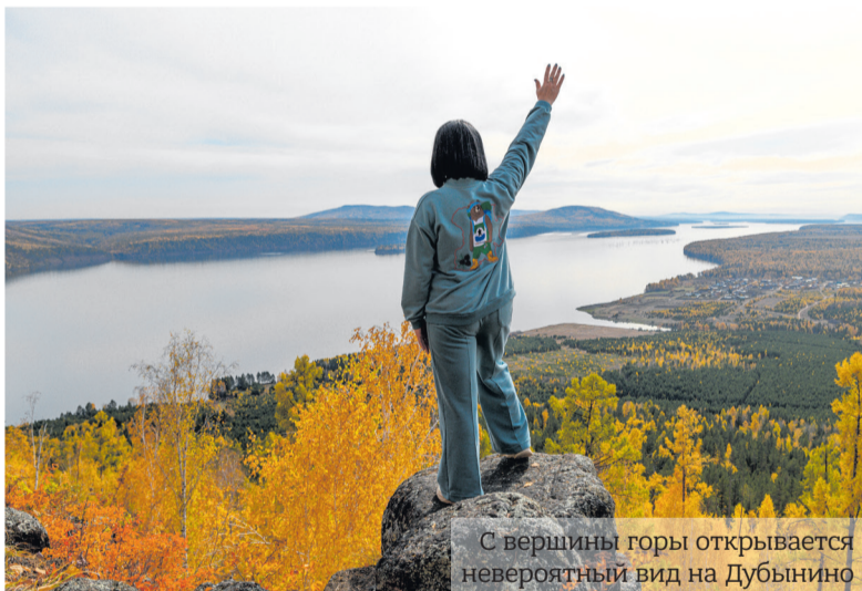
С вершины горы открывается невероятный вид на Дубынино

В конце сентября ребята и коллектив интерната пригласили друзей учреждения, волонтеров, помощников, фотографов и журналистов посмотреть на результаты своего труда - на официальное открытие «тропы здоровья». Туристическая группа стартовала рано утром от местного клуба. Идти предстояло примерно два часа в одну сторону с короткими остановками. Во время привала гиды-экскурсоводы познакомили гостей с историей села Дубынино.