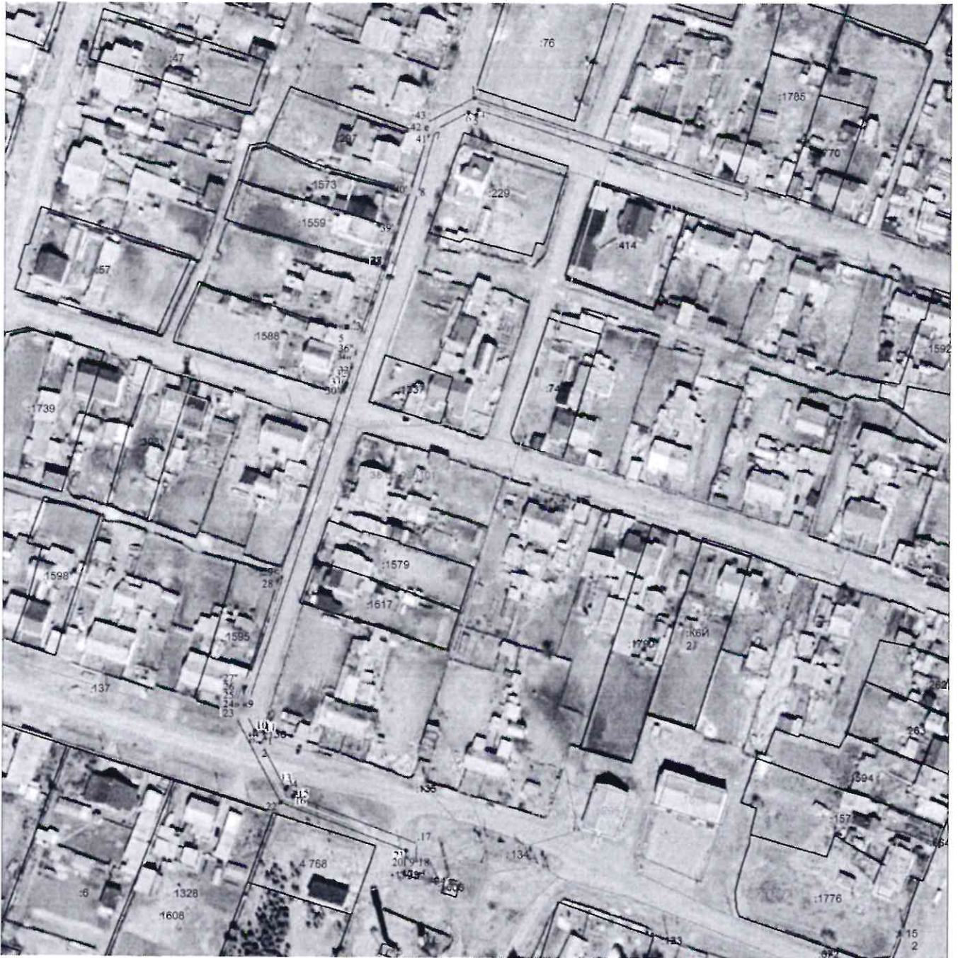
Схема расположения границ публичного сервитута Публичный сервитут для строительства и эксплуатации объекта электросетевого хозяйства "ВЛИ-0,4кВ от ТП №543"