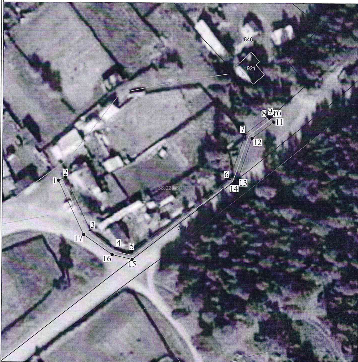
Схема расположения границ публичного сервитута Публичный сервитут для строительства и эксплуатации объекта электросетевого хозяйства "ВЛИ-0,4 кВ от ТП №101"