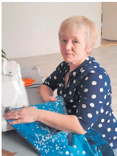
балаклавы и подушки направлены по назначению для солдат в зоне проведения СВО.