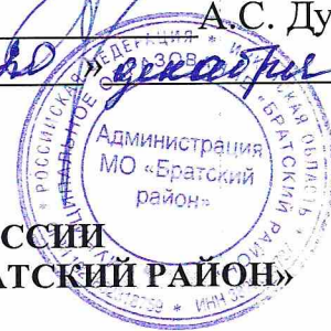
ГРАФИК ЗАСЕДАНИЙ АНТИНАРКОТИЧЕСКОЙ КОМИССИИ МУНИЦИПАЛЬНОГО ОБРАЗОВАНИЯ «БРАТСКИЙ РАЙОН» на 2022 год.